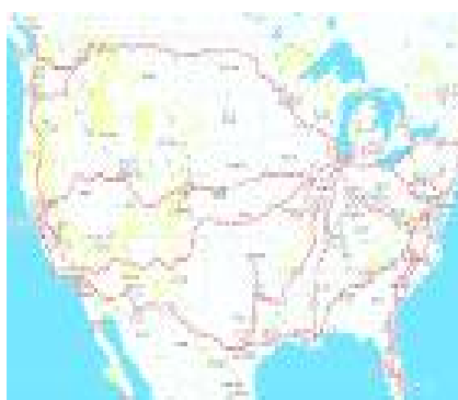
주요 철도 노선