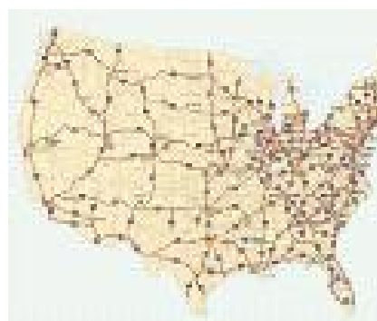
주요 고속도로 노선