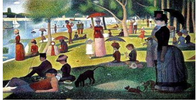
[그랑드자트 섬의 일요일 오후, 조르주 피에르 쇠라]