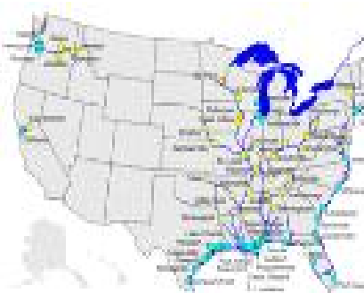
주요 운하 지도