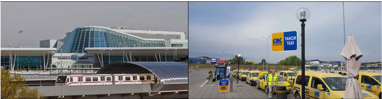
<지하철 및 택시>