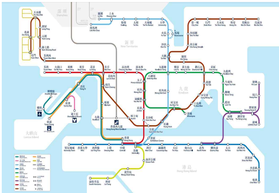
<홍콩 MTR 노선도>