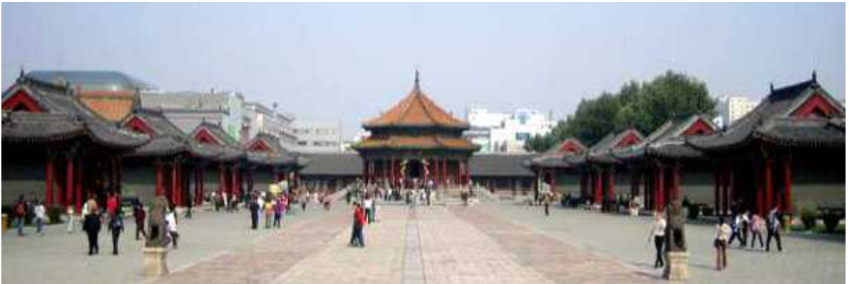
(청나라 발원지 - 선양 故宫)

1625년, 여진족 국가인 후금(后金)이 랴오양(辽阳)에서 선양으로 천도하며 1636년에 지어진 왕궁으로 청조(清朝) 건국의 기초를 닦은 태조 누루하치(努尔哈赤: 1559-1626년)와 태종 황타이지(皇太极: 1592-1643년)가 실제로 이 궁에 거주하였음. 청나라 황실이 북경으로 천도하기 전까지 청나라의 첫 번째 궁이었으며, 6만 평방미터의 부지에 만주식 건물의 특징을 지닌 90여 개의 건축물로 구성되어있음