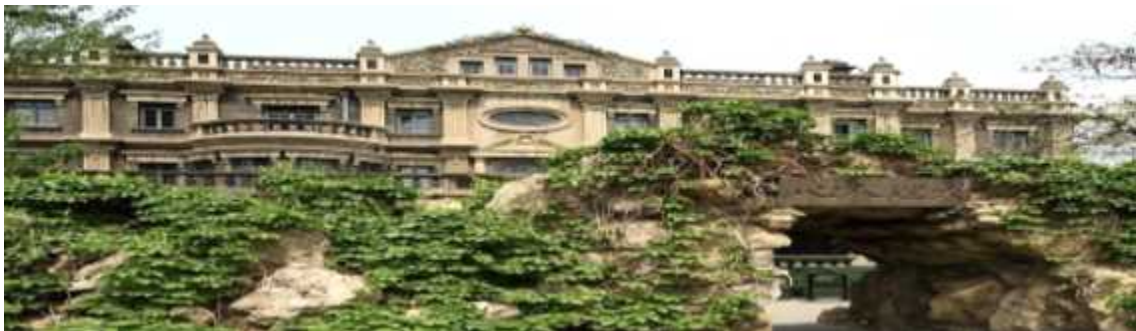
(장작림, 장학량 저택 张氏帅府)

봉천계(奉天系) 군벌의 수령이었던 장작림(张作霖)과 그의 장남인 장학량(张学良)의 관저 겸 사택. 1914년에 창건되었고 부지면적은 3만 평방미터에 달하며, 당시 동북지방의 패권을 장악했던 장씨 일가의 옛 모습을 보여주고 있음