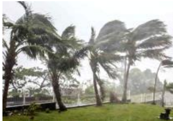
<모리셔스 우기철의 사이클론>