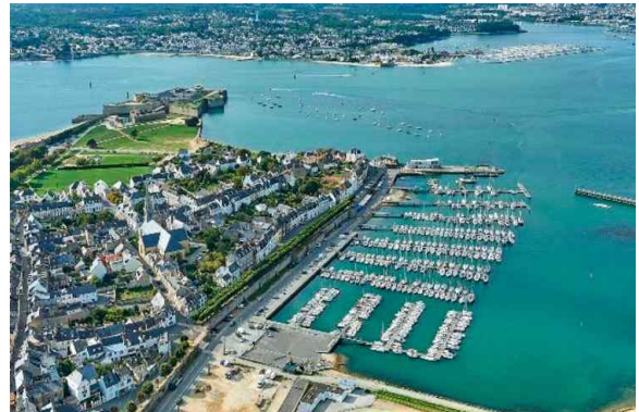
<모리셔스 수도 포트루이스>