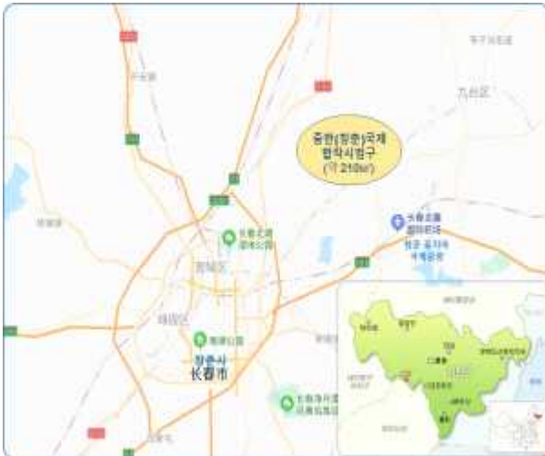
< 시범구 위치도 >