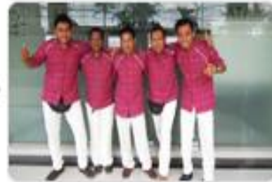
Matahari Bali - Driver 마타하리 발리 운전기사