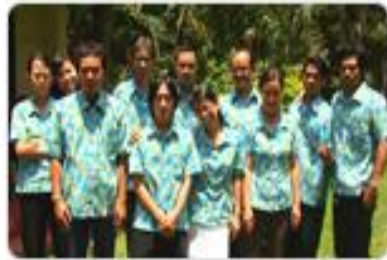
Matahari Bali - Office 마타하리 발리 사무실 직원