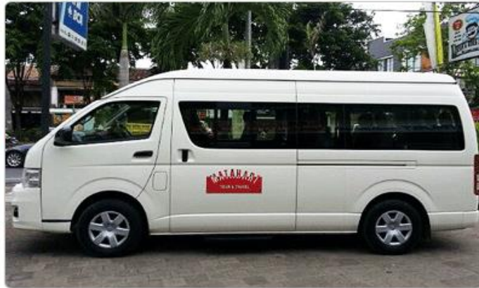
발리 사무소 보유 차량 : 스즈키 아베베 (APV) | 도요타 기장 이노바 | 기아 세도나 (카니발) | 도요타 하이에이스(HiAce)