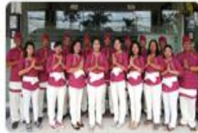
Matahari Bali - Guide 마타하리 발리 현지인 가이드