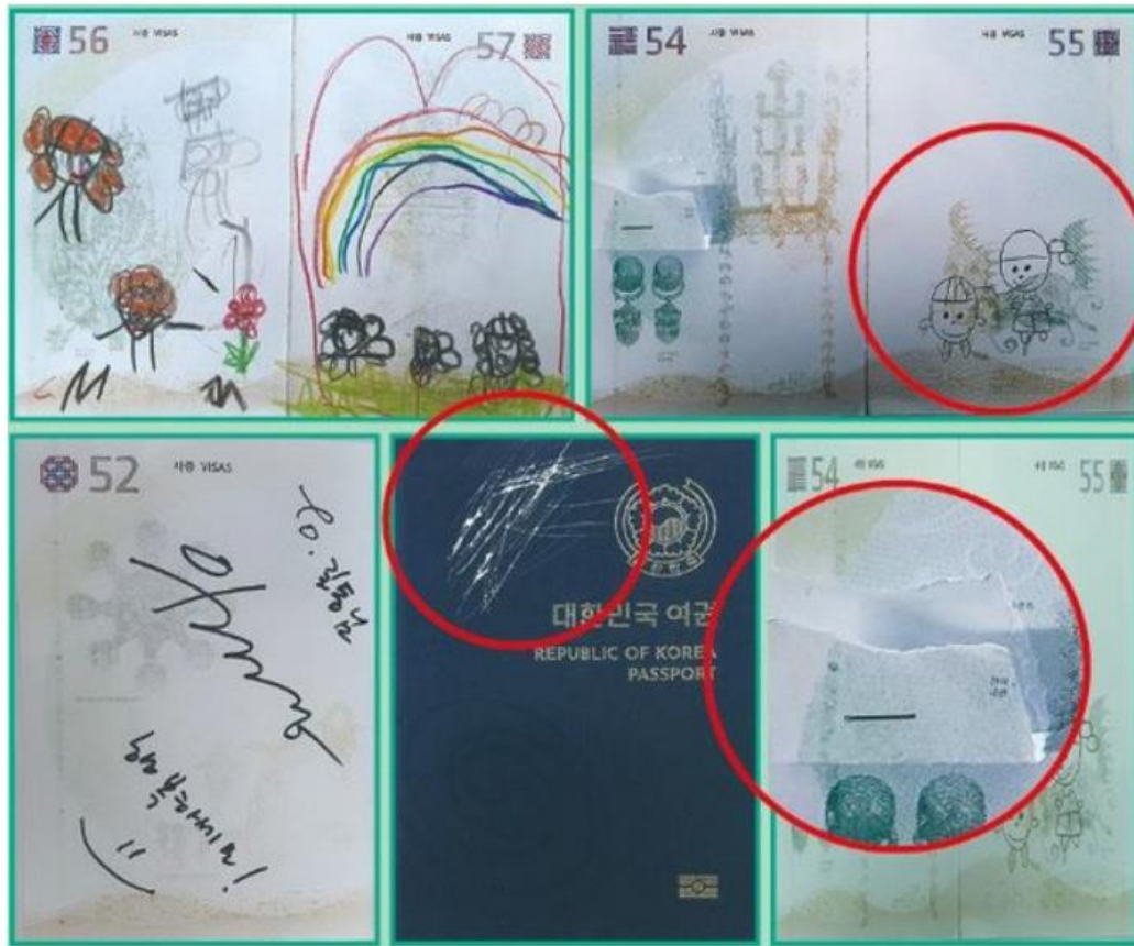
출처 : 다음 중앙일보 "비행기 못 타세요" 손톱만 한 얼룩에 탑승거부 당했다, 무슨일' 중 발취