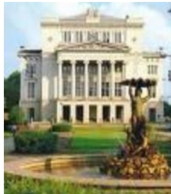
국립 오페라 하우스