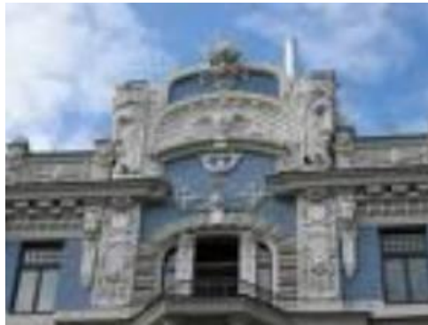
리가 역사 지구