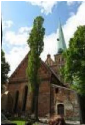
성 야곱 교회

'백악관'이란 별칭으로 불릴 정도로 화려한 내부 장식을 갖춘 유럽에서 가장 아름다운 오페라 하우스에 속하며 매년 여름 국제 오페라 페스티벌은 세계적으로 유명함. 공연이 없는 평일에도 일반인들에게 개방.