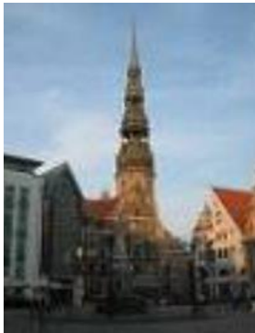
성 피터 교회

다우가바강(Daugava River) 오른편에 있던 재래시장을 대체하기 위해 만든 대형시장으로 1930년에 개장함. 2층 구조의 아르데코 스타일