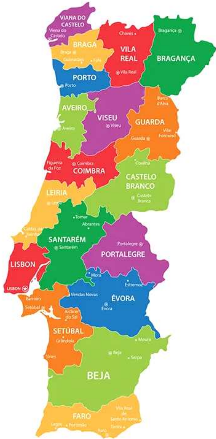
< 포르투갈 지도 >