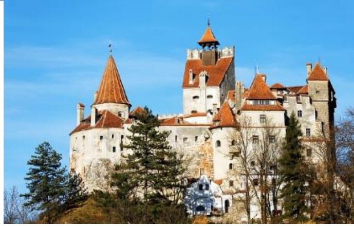
브란 성 ( 드라쿨라 성 )