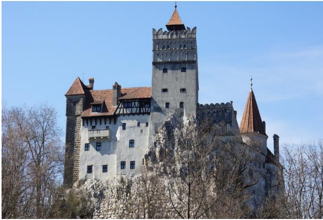
( 브란 성 )