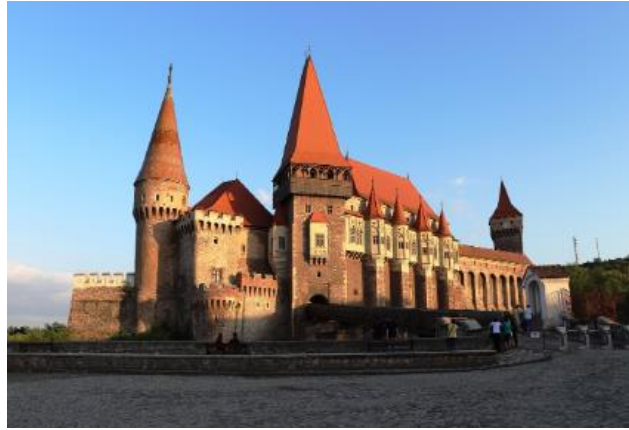
( 코르빈 성 )

뜨거운 한여름, 무더위를 어떻게 이겨내고 계신가요? 공포영화를 보거나 공포체험을 하는 등 으스스함으로 더위를 물리치는 것도 한 방법일 수 있는데요. 공포소설 '드라큘라(Dracula)'의 배경이 15세기 루마니아 왈라키아 왕국의 '블라드 쩌베쉬(Vlad Tepes)' 왕인데요, 그가 실제로 지냈던 브란 성(Bran castle) 은 벌써 유명한 관광명소입니다.