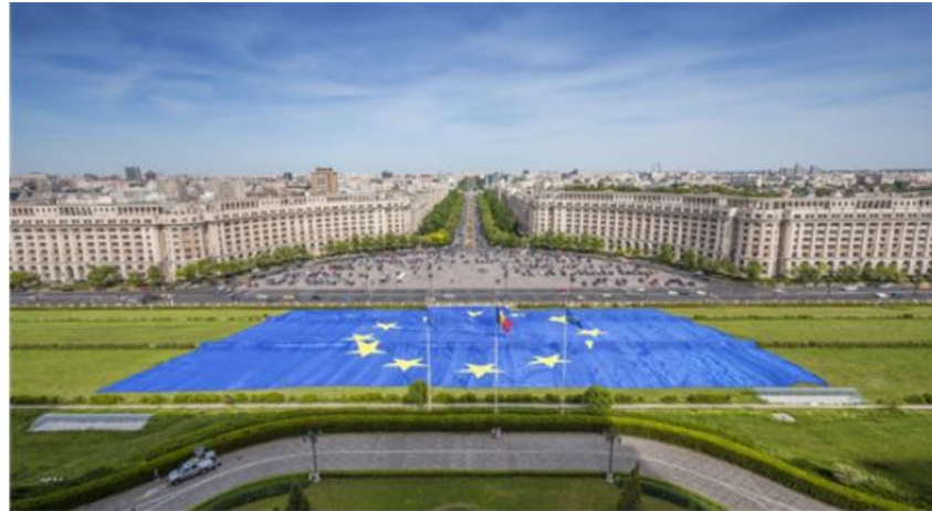
의회공전 앞 광장과 통일대로

의회공전 관람 코스의 백미는 쪽 뺨은 통일대로와 의회공전 앞 광장이 한 눈에 들어오는 테라스입니다. 의회공전의 테라스에 서면 과거 공산당 간부들과 정부 주요 인사들에게 제공됐던 아파트(현재는 정부 기관들 및 일반 시민 거주 아파트)와 함께 통일 광장까지 쪽 뺨은 통일대로가 한 눈에 들어옵니다. 통일대로는 파리의 샹젤리제거리를 본 따서 만들었다고 하여 부쿠레슈티의 샹젤리제라 불리기도 합니다.