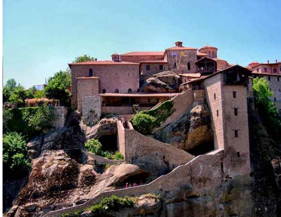
<대 메테오른 수도원>

메테오라에서 가장 크고, 가장 오래된 수도원으로 바위 높이가 무려 534m에 이른다. 관광객들은 다리를 건너 바위를 파서 만든 돌계단을 따라 올라가 수도원으로 들어갈 수 있다. 가장 많은