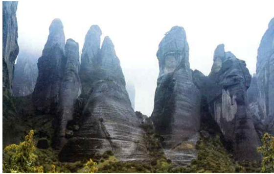
<메테오라의 기암 괴석>

아테네에서 400km 떨어진 그리스 테살리아 지방의 북서부 트리칼라주에는 기둥 모양의 깎아내린 듯 솟아 있는 바위 위에 세워진 수도원들이 모여 있다. 칼람바카(Kalambaka)라는 작은 마을 북쪽 편에 위치한 이곳을 우리는 ‘메테오라’라고 부르는데, 그리스어로 “공중에 떠 있는 수도원”이라는 뜻을 가지고 있다. 바위들의 평균 높이는 300m에 이르며, 550m 높이에 이르는 것도 있다.