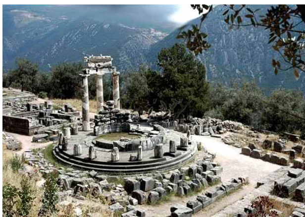
<가이아의 델로스 원형 신전>

아폴론 신전은 기원전 6세기 무렵에 처음 세워져 아폴론의 신앙과 신탁이 전 세계로 퍼져 나갔다. 전설에 따르면 델피에 있는 이 신탁소는 원래 대지의 여신 가이아의 것이었는데, 가이아의 아들인 피톤이 이곳을 지켰으나, 후에 아폴론이 어머니인 레토의 해산을 방해한 피톤을 죽이고 그의 무덤위에 자신의 신탁소를 세웠다고 한다. 레토는 제우스의 쌍둥이 아이, 아폴론과 아르테미스의 어머니이자 다산의 신으로, 레토가 쌍둥이 아이를 가졌을 때 이를 시기한 헤라 여신이 괴물 뱀 피톤을 시켜 해산을 방해하도록 하였으나, 레토는 피톤을 피해 델로스 섬에서 아폴론과 아르테미스를 낳았다.