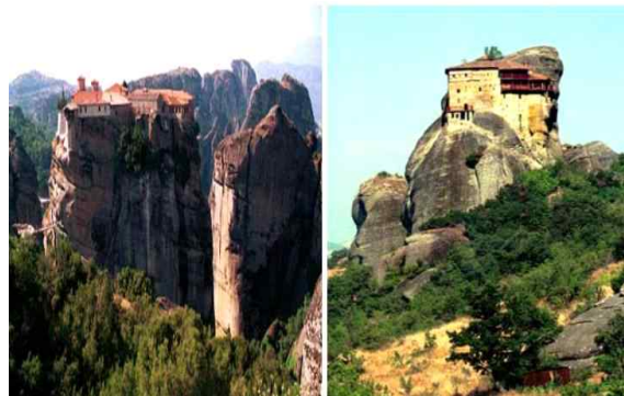
<바위위에 세워진 수도원>

1960년대 초 도로가 건설되어 메테오라를 찾는 관광객들이 많아짐에 따라 젊은 수도사들은 이곳으로 오기를 기피했고, 기존의 나이 많은 수도사들 또한 인적이 드문 아토스 산으로 거처를 옮겨가 현재는 이곳에서 수도사들을 만나기는 쉽지 않다.