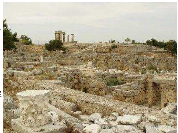
<코린트 유적 전경>

이곳에는 기원전 6세기경에 태양신 아폴론을 모시기 위해 세운 아폴론 신전이 자리 잡고 있는데, 그리스 신전들 중 올림피아의 헤라 신전 다음으로 오래된 것이라고 한다. 또한 신전 남쪽으로는 극장, 상점 등의 흔적이 남아있다.