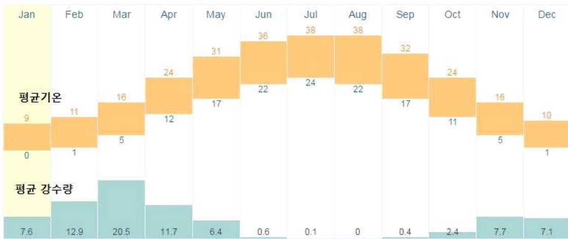
Annual Weather Averages in Ashgabat