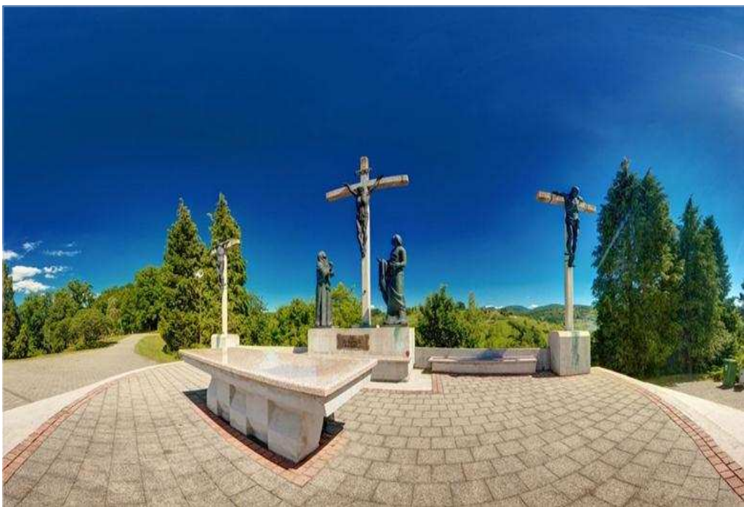
예수 그리스도 고난의 길 언덕 전경