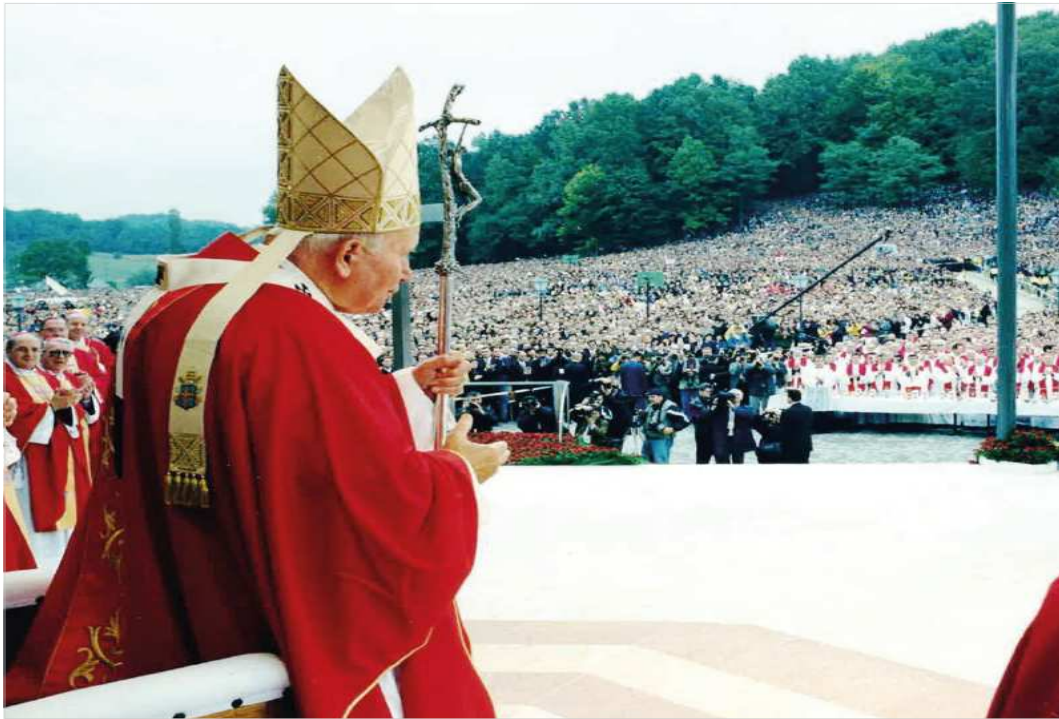
1998년 교황 요한 바오로 2세의 방문 모습