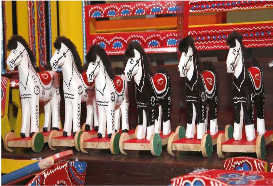
마리아 비스트리차 전통 목제완구