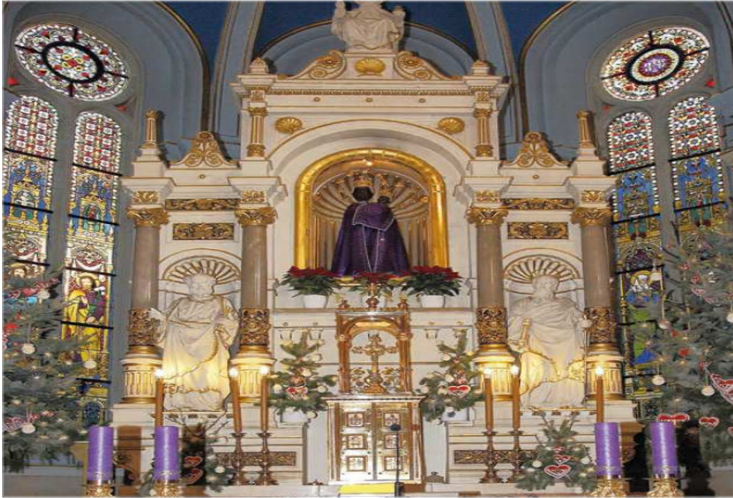
성모마리아 성당 내에 위치한 목재 성모마리아상