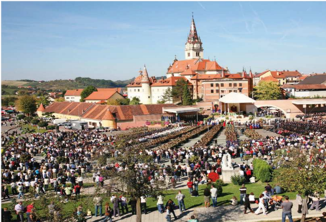
마리아 비스트리차 성모마리아성당 전경