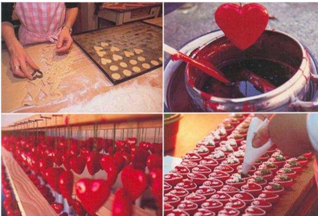
마리아 비스트리차 전통 생강과자