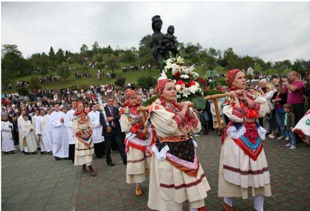
마리아 비스트리차의 각종 문화 축제 모습